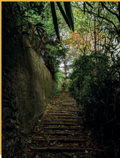
Muro in pietra di contenimento della scarpata di monte, interessato da un fenomeno di smottamento e crollo nel marzo 2024.

Il percorso, seppur breve, attraversa un'area, ora in parte ricoperta dal bosco, caratterizzata dalla presenza di luoghi di interesse storico e panoramico tra cui muri a secco, terrazzamenti e la spettacolare