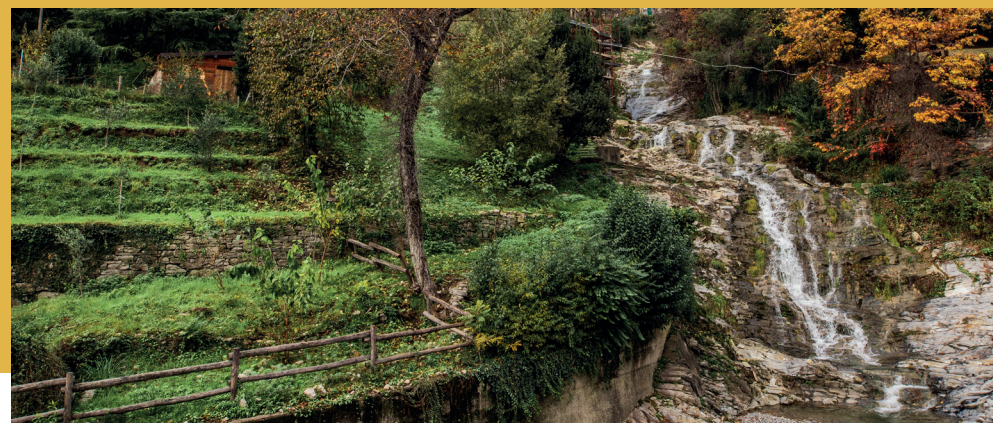
Scorcio panoramico sul Torrente Greggio e sui terreni terrazzati, a testimonianza della pratica agricola del passato.

documentata in questi luoghi da tempi remoti. Nel 1939 il comune acquistò "terreno, sorgenti e fabbricati" a monte della località Oliera per costruirvi la scuola di Campo Solare e, a quel tempo, parte della proprietà era ancora coltivata a vite. Il sentiero oggi ha acquisito la funzione di migliorare la viabilità pedonale tra il centro cittadino e le contrade "alte".