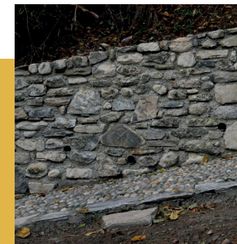
Comparazione degli interventi di recupero e rifacimento, prima e dopo il crollo della muratura di sostegno a monte del tracciato di Via Oliera

cascata formata dal torrente Greggio, che giunge fin qui dalla pendici del Monte Bisbino. Già noto come il "sentée de l'oli", il tracciato univa la frazione di Asnigo con il centro di Cernobbio, risalendo tra orti e campi, già chiamati in documenti del XVI secolo "in oliverio". Questi toponimi fanno con ogni probabilità riferimento alla presenza dell'olivicoltura, già